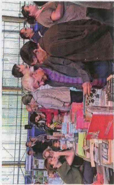
■ Le public pourra rencontrer tout le week-end les auteurs présents. Photo d'archives

Cette année, la marraine est Dorine Bourneton, la première femme handicapée pilote de voltige, déjà venue en 2003 pour son premier